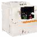
серия MCI серия общего применения